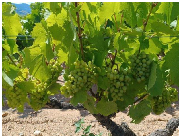
Stade fermeture de grappe le 4 juillet au Domaine Ludovic Emmetière, dans le secteur des Beaujolais Villages à Saint-Etienne-la-Varenne lieu-dit Moulin-à-Vent, un terroir précoce, cépage gamay noir à jus blanc.

Le mois de mai 2022 restera gravé longtemps dans les mémoires. Celui-ci a été marqué par une chaleur persistante (3°C au-dessus de la normale, mois de mai le plus chaud depuis 1959), une sécheresse (moins de la moitié de la pluviométrie normale d'un mois de mai) et un ensoleillement très élevé (deuxième mois de mai le plus ensoleillé depuis 1991). La floraison s'est alors enclenchée très rapidement et dans des conditions favorables. Le rafraîchissement des températures et la pluie survenue autour du 23 mai ont néanmoins permis une pousse normale de la végétation. Le stade fin floraison a été atteint en moyenne le 28 mai.