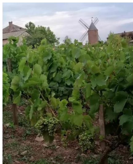
Stade fermeture de grappe (bientôt véraison) le 5 juillet au Château Portier, dans le secteur des crus du Beaujolais à Moulin-à-Vent lieu-dit Clos Portier, un terroir très précoce, cépage gamay noir à jus blanc.