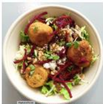
Recette de Manon MAURICE