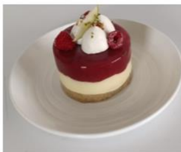
Recette d'Elena BURLACU