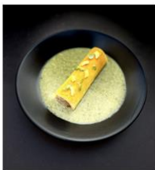
Recette de Lucile ESPAGNE