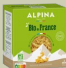
Bio de France, Nouilles Savoisiennes, 500g, 2,15€**