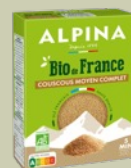
Bio de France, Couscous moyen au blé complet, 500g, 2,15€**