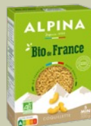
Bio de France, Coquillettes, 500g, 2,15€**