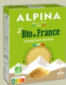
Bio de France, Couscous, 500g, 2,15€**

La gamme Bio de France d'Alpina Savoie rassemble une large sélection de pâtes du quotidien élaborées à partir de blé dur bio 100 % français, et selon un savoir-faire pastier transmis depuis 1844. Coquillettes, avoines, perles, penne, farfalle, ou encore nouilles savoisiennes : elle propose des formats adaptés à tous les usages et à toutes les envies.