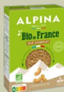
Bio de France, Coquillettes au blé complet, 500g, 2,15€**