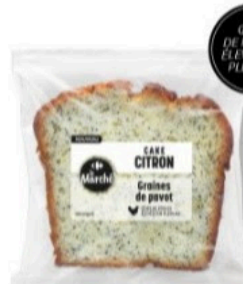
CAKE CITRON GRAINES DE PAVOT 90g - 1,99€ la part

Sans oublier les classiques revisités dans un tout nouvel habillage : wrap, poke ou salades (sources de fibres pour les bases légumineuses), pour redécouvrir les recettes qui ont déjà fait chavirer les cœurs.