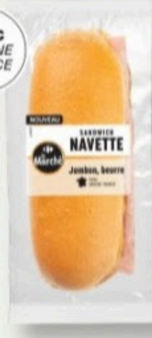
NAVETTE JAMBON BEURRE 85g - 2,45€