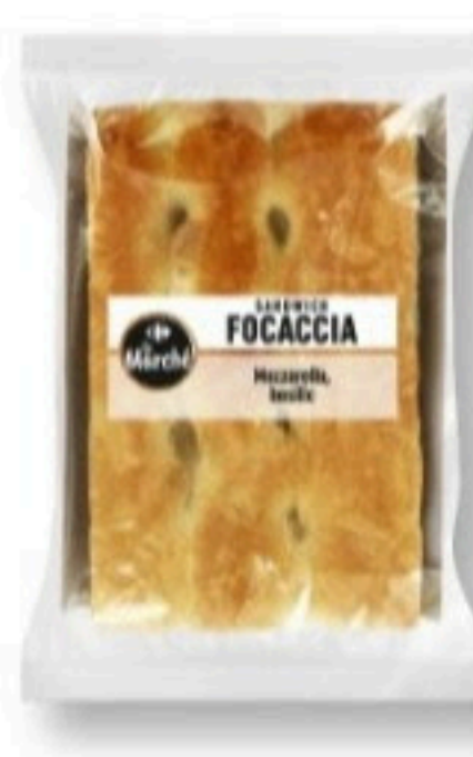
FOCACCIA MOZZARELLA BASILIC 160g - 3,89€