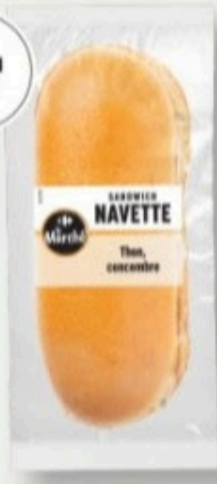
NAVETTE THON CONCOMBRE 85g - 2,35€