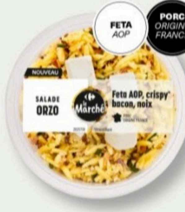
MINI SALADE ORZO, FETA AOP, CRISPY BACON ET NOIX 200g - 3,80€