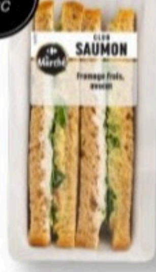
SANDWICH CLUB SAUMON 170g - 4,99€