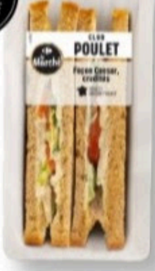
SANDWICH CLUB POULET 170g - 4,69€