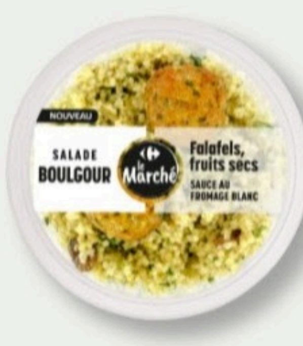
MINI SALADE BOULGOUR FALAFEL ET FRUITS SECS 220g - 3,45€