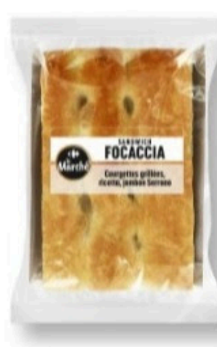
FOCACCIA COURGETTES GRILLÉES, RICOTTA ET JAMBON DE SERRANO 160g - 3,99€