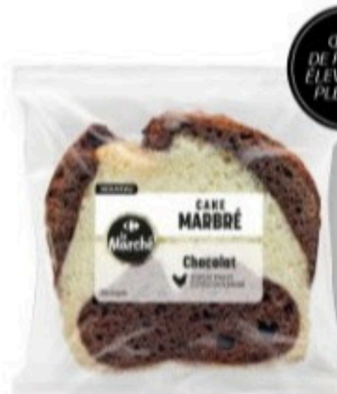
CAKE MARBRÉ CHOCOLAT 90g - 1,99€ la part