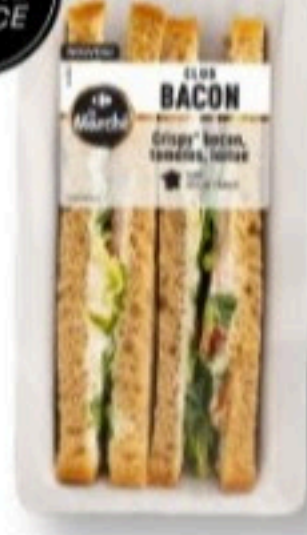
SANDWICH CLUB BACON 170g - 4,69€