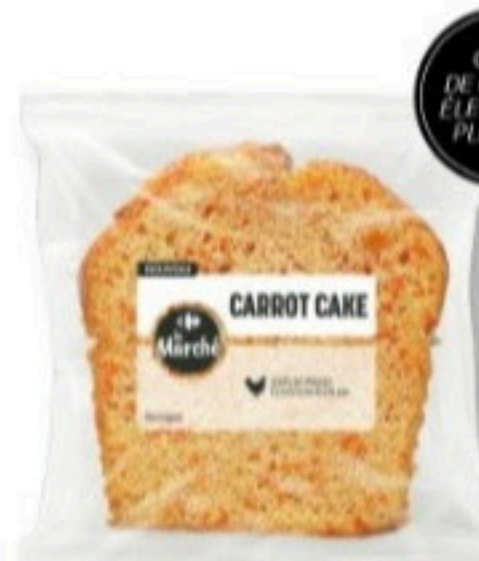
CARROT CAKE 90g - 1,99€ la part