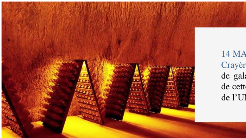
Crayères de la Maison Ruinart

14 MAI 2022 : Voyage exceptionnel au cœur des Crayères de la Maison Ruinart à travers un dîner de gala unique servi dans les caves historiques de cette Maison, inscrites au Patrimoine Mondial de l'UNESCO.