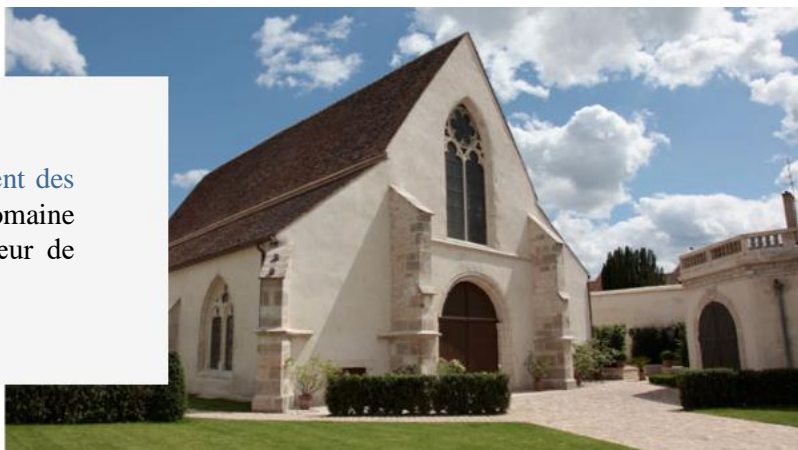
Couvent des Jacobins

17 JUIN 2022 : Dîner d'exception au Couvent des Jacobins de la Maison Louis Jadot, un domaine emblématique de la Bourgogne en plein cœur de Beaune.