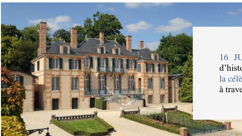
Château de la Marquetterie

16 JUILLET 2022 : Explorez les secrets d'histoire du Château de la Marquetterie de la célèbre Maison de Champagne Taittinger à travers un déjeuner estival inoubliable.