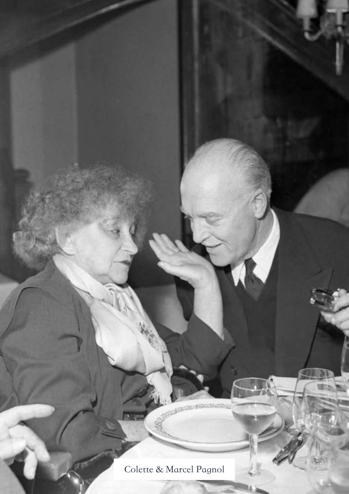
Colette & Marcel Pagnol