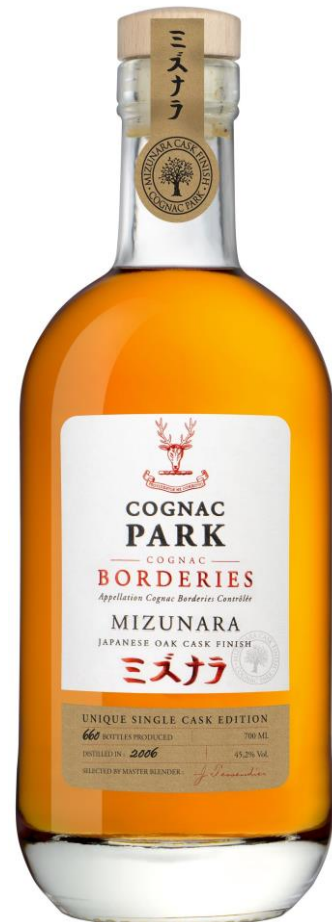
COGNAC PARK BORDERIES MIZUNARA SINGLE CASK 2006

Assemblage d'eaux-de-vie 100% Borderies. Ce cognac passe 10 mois en fût de chêne neufs puis est mis en fût roux. À la fin de sa période de vieillissement de 12 ans, il passera 9 à 12 mois