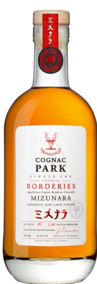
COGNAC PARK BORDERIES MIZUNARA ORIGINAL

Avec la gamme Mizunara, Cognac PARK s'aventure au-delà des frontières classiques en proposant des cognacs innovants avec une touche résolument contemporaine.