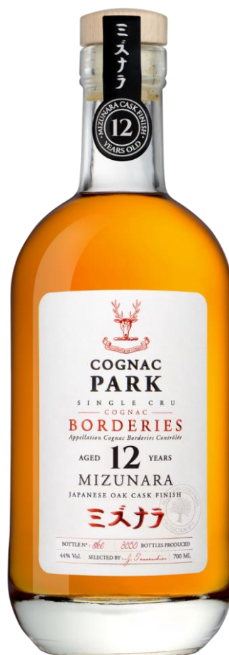
COGNAC PARK BORDERIES MIZUNARA 12 ANS

Assemblage d'eaux-de-vie 100% Borderies. Ce cognac passe 10 mois en fûts de chêne neufs puis est mis en fûts roux. À la fin de sa période de vieillissement de 4 ans, il sera affiné 6 mois en fûts