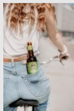
Sant Erwann - IPA