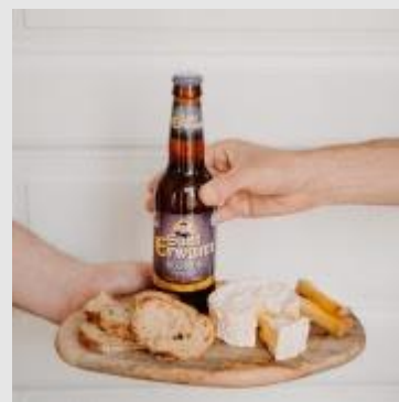
Sant Erwann Original - Blonde