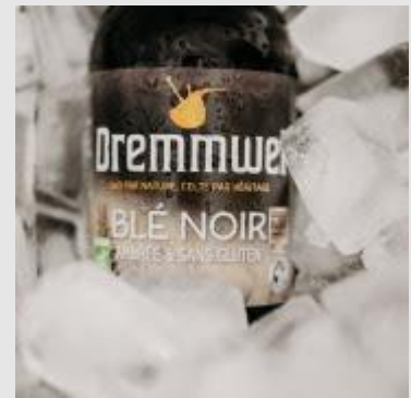
Dremmwel - blé noir sans gluten

En février dernier, sa bière Sant Erwann Originale , a été médallée de Bronze dans la catégorie « Bières Blondes » lors de la 129 ème édition du Concours Général Agricole 2022 . Profondément enraciné dans le patrimoine gastronomique français, le Concours Général Agricole tient plus que jamais une place de cœur et de choix auprès des consommateurs en quête de qualité et de réassurance. Avec près de 22 000 produits et vins inscrits au concours, il n'existe pas d'équivalent à l'étranger tant en nombre qu'en diversité de produits en compétition.