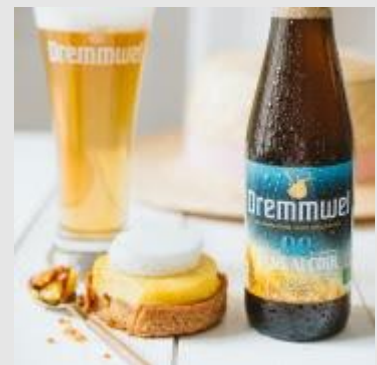
Dremmwel 0,0% - sans alcool