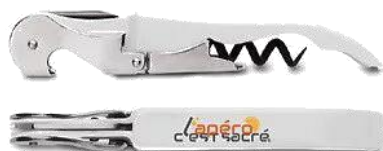
Le Couteau Sommelier