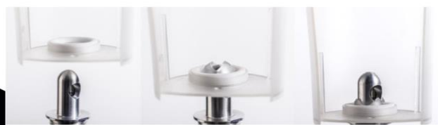
Mouvement circulaire reproduisant le tirage traditionnel

En outre, Beer-Up System est une solution écologique : les gobelets fournis sont réemployables et fabriqués en France . En plastique solide et résistant, ces gobelets incassables sont conçus pour durer, avec un design imaginé pour que l'utilisation soit agréable. Et pour se démarquer, il est également possible de les personnaliser !