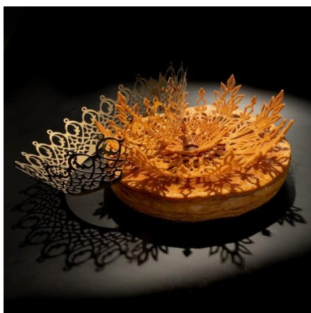
LE FLOCON DES ROIS

ÉLUE MEILLEURE PÂTISSIÈRE DU MONDE EN 2023, NINA MÉTAYER PROPOSE SA COLLECTION DE GALETTES EN EXCLUSIVITÉ AU PRINTEMPS DU GOÛT DU 4 AU 31 JANVIER 2024