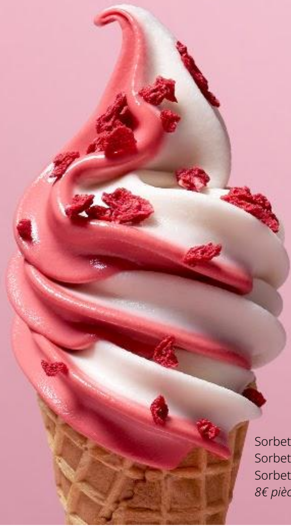
Sorbet Letchi & Rose Sorbet Ispahan Sorbet Infiniment Framboise 8€ pièce

Turbinées et servies à la minute, ces créations se distinguent par leur texture particulièrement légère et lisse. Plus aériennes qu'une glace traditionnelle, elles fondent délicatement en bouche et révèlent avec finesse toute la richesse de leurs saveurs. Cette offre glacée végétale invite à une dégustation à la fois gourmande et légère, sublimant l'art de la glace selon Pierre Hermé.