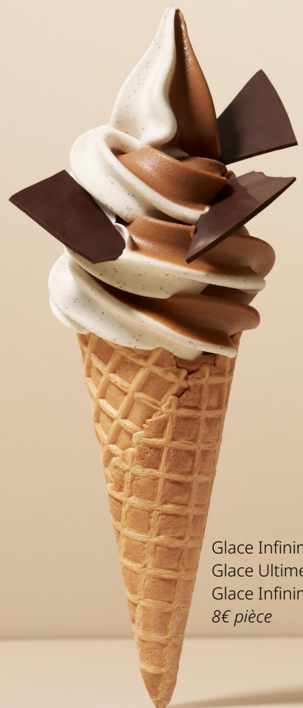
Glace Infiniment Chocolat Glace Ultime Glace Infiniment Vanille 8€ pièce