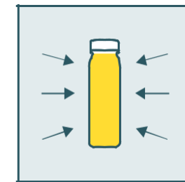
2. Stabilisation à froid

Appelé HPP (High Pressure Pasteurisation), c'est le processus de conservation le plus respectueux et celui utilisé dans les pressées végétales et boissons végétales Phyte.