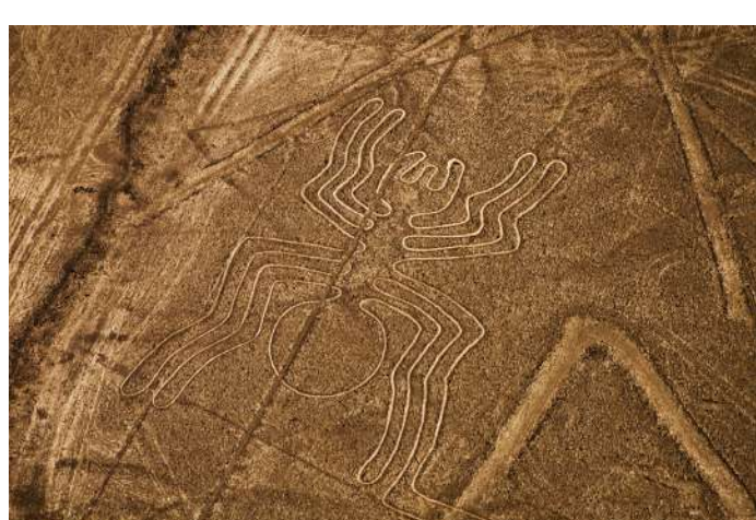
Mondialement connues, les lignes de Nazca reflètent le ciel sur la terre.

Elle est d'ailleurs la plus grande zone de production du Pérou, où de nombreuses caves se distinguent par leur beauté et leur tradition, où il est possible d'apprendre à déguster la boisson nationale en compagnie de ses fabricants, qui expliquent comment elle est fabriquée et comment la déguster.