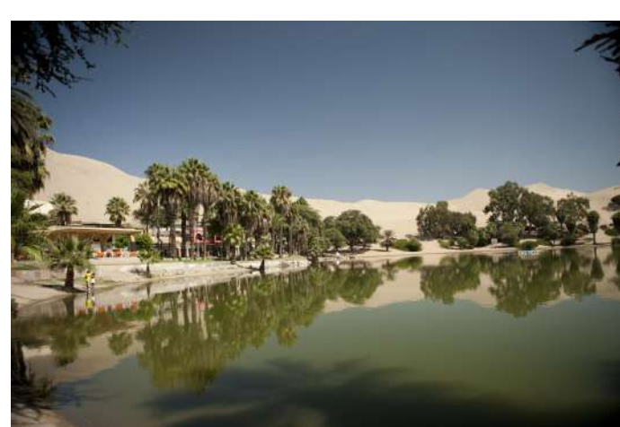
La Huacachina n'est pas un mirage.

Encore inexplicables aujourd'hui et appréciées depuis les hauteurs ou en les survolant, les lignes de Nazca sont ces fameux géoglyphes aux dimensions colossales. Situées entre les villes de Nazca et de Pampa, elles couvrent plus de 520 kilomètres carrés et abritent plus de 150 figures représentant des humains, la flore et la faune, ainsi que quelques tracés géométriques.