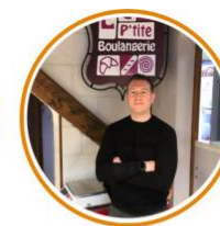
La p'tite boulangerie