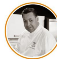
L'atelier par P. Baillet