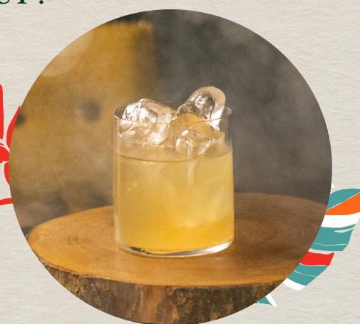
Le voyageur : La Havane

Gin Canaïma, Aperol, Jus de citron vert, Pamplemousse.