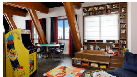
Hôtel Marielle - L'espace enfants