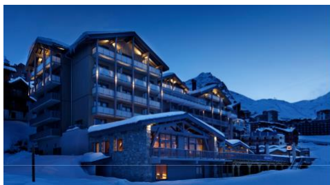
Hôtel Marielle - La façade de nuit

Idéalement situé sur le front de neige à Val Thorens, le tout nouvel Hôtel Marielle accueille les familles pour des vacances à la neige placées sous le signe de la convivialité. Dans un style sport chic, l'établissement 4 étoiles offre des services haut de gamme et originaux à ses hôtes pour un séjour familial mémorable.