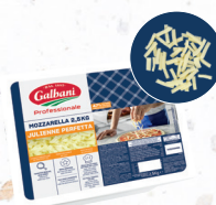
Mozzarella PERFETTA - Julienne 8 mm