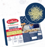
Mozzarella et Emmental ESTREMO - Râpé 2 mm