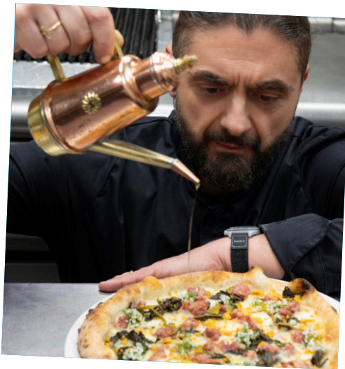
PIZZA SALSICCIA FRIARIELLI