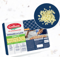
Mozzarella CUBETTI - Cube (plus gros qu'une cossette) 6,4 mm