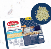
Mozzarella OPTIMA - Brin fin 3,2 mm