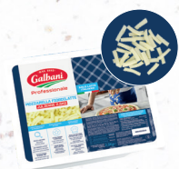
Mozzarella FIORDILATTE - Julienne 8 mm