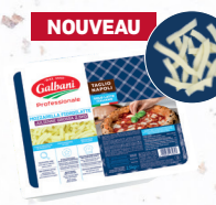
NOUVEAU Mozzarella FIORDILATTE - Taglio Napoli (très gros brins) 12 mm