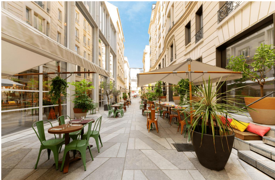
Terrasse La Piazza

Les beaux jours arrivent et les envies d'apéro se font ressentir ! Direction Eataly Paris Marais (ou le site marchand : www.eataly.fr ) pour découvrir les 6 000 références de produits Italiens de haute qualité. Sur la terrasse, on y déguste le vrai aperitivo !