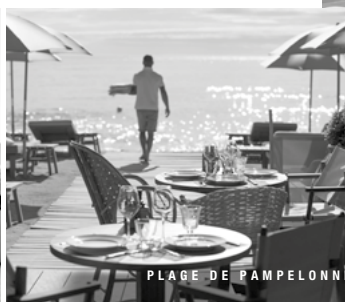
PLAGE DE PAMPOLONNE