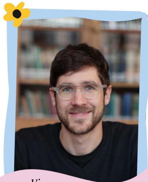
Vi c h e

Diplômé d'un Bachelor en économie (HEC Montreal), Master en Affaires Internationales (Sciences Po Paris) Fondateur d'une start-up à impact aux Philippines.