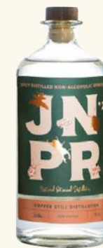
JNPR n°2 70 cl • 31,90 €