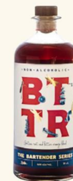
BTTR n°1 70 cl • 28 €