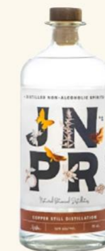
JNPR n°1 70 cl • 28 €