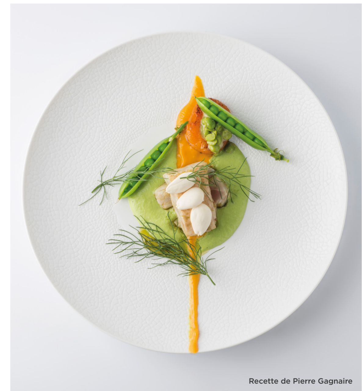
Recette de Pierre Gagnaire