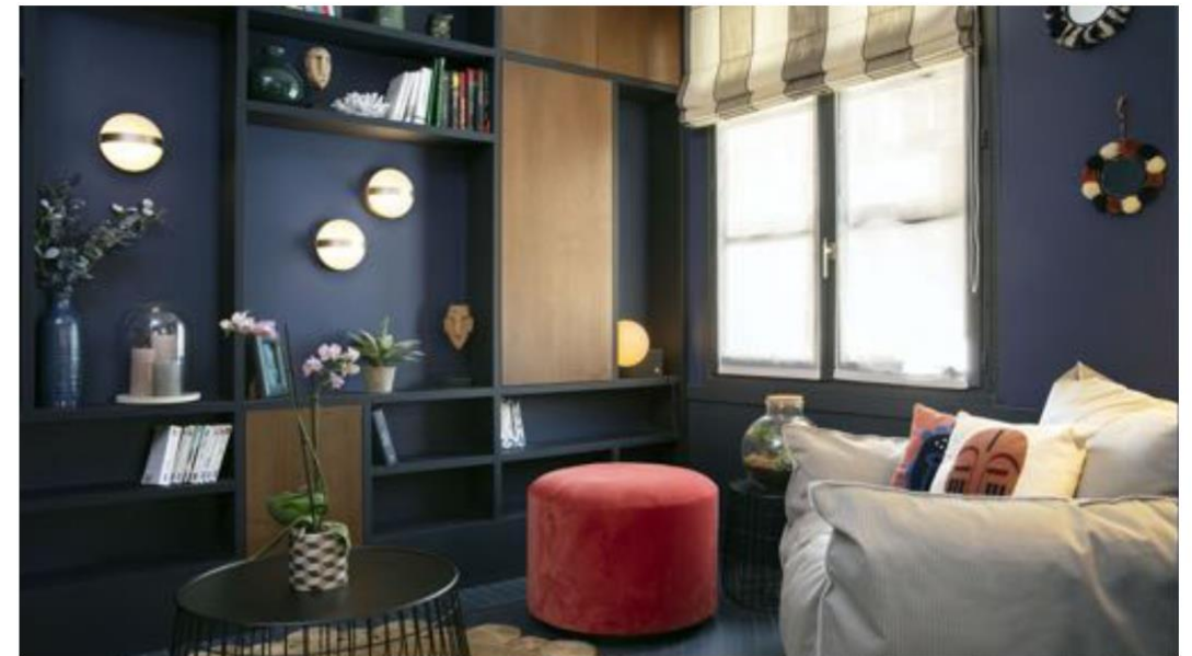
Hôtel Bastille Speria