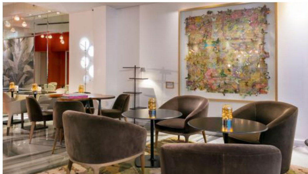
Hôtel de Sèze