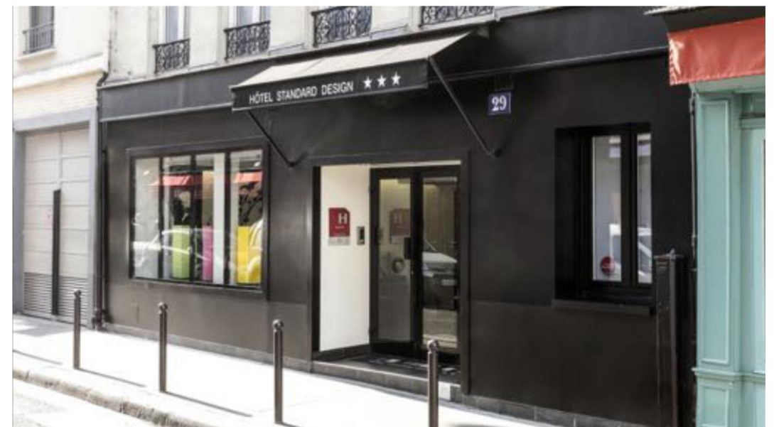
Hôtel Standard Design