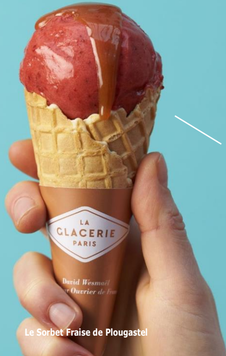
Le Sorbet Fraise de Plougastel