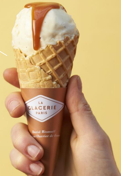
La Glace au lait Ribot

Pour ajouter plus de gourmandise, un caramel au beurre salé de la Maison Le Roux peut venir surmonter ces parfums.