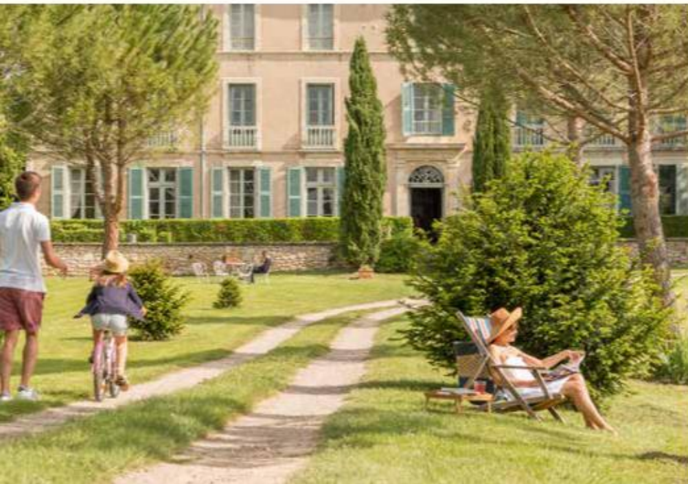
Domaine de La Monestarié