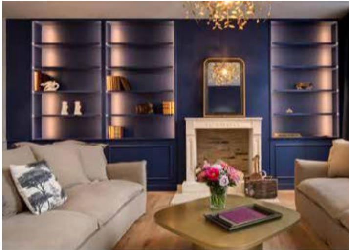
Château Fage