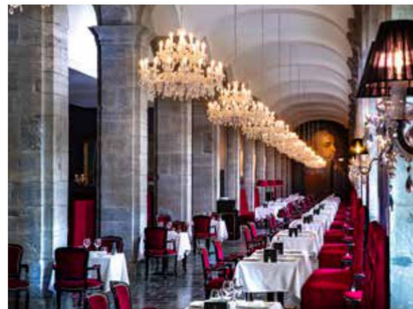
Royal Hainaut SPA & Resort Hotel