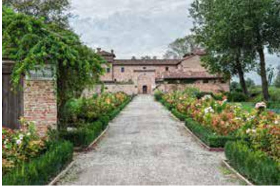
Antica Corte Pallavicina