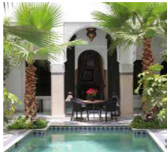
Le Riad Monceau