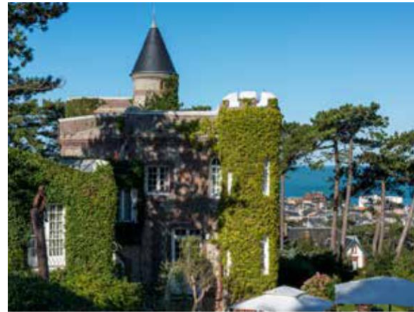
Le Donjon - Domaine Saint Clair