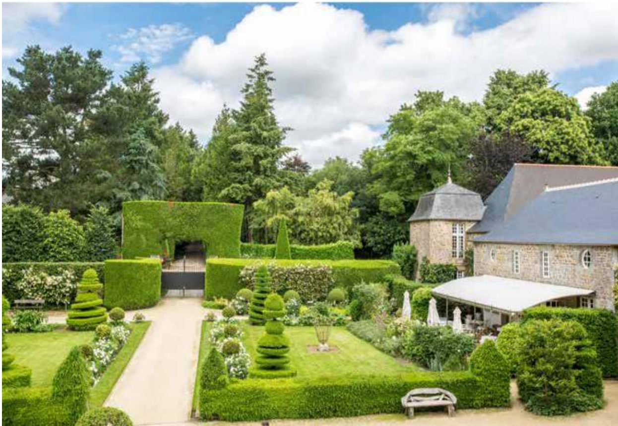
Château de la Ballue