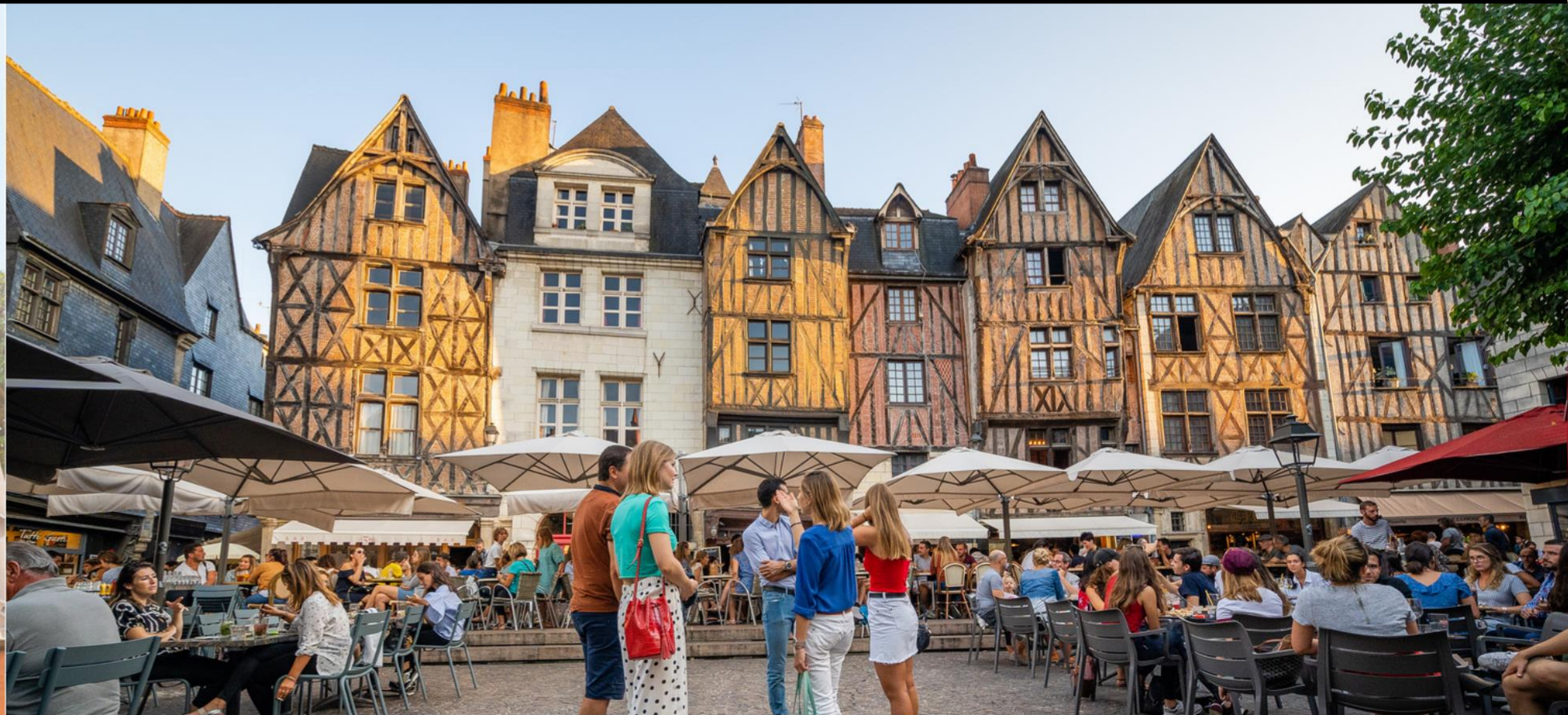
La place Plumereau, avec ses maisons à colombages du XVe siècle, est LE lieu qui ne dort jamais. En été, c’est un must pour profiter du soleil. En hiver, les décorations l’habillent à merveille.