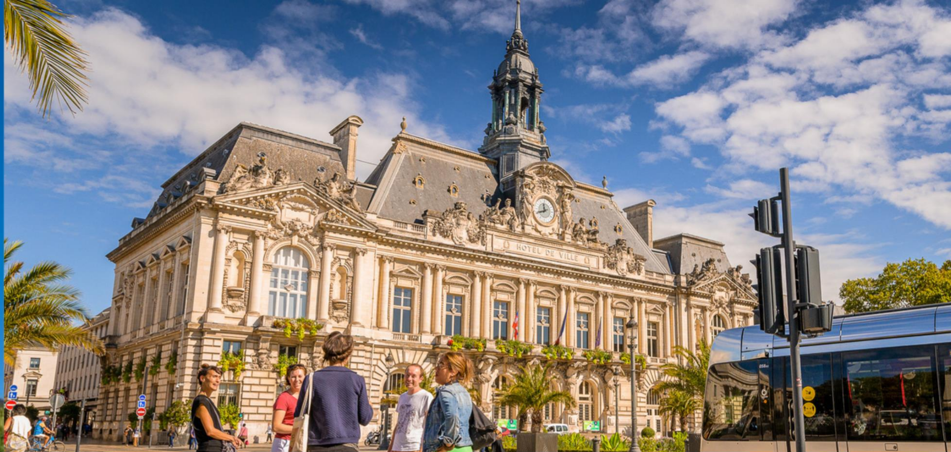
L’hôtel de ville et le palais de justice, avec leurs statues et colonnes, affichent un visage radicalement différents le jour et la nuit.