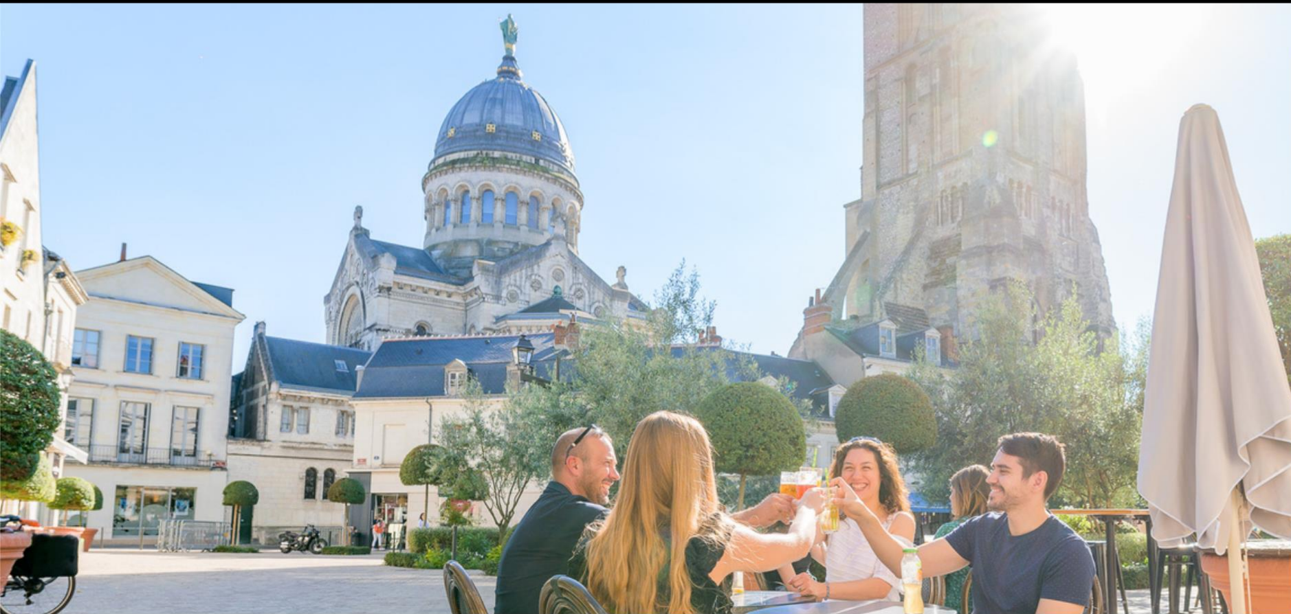
La place Châteauneuf, au charme typiquement italien, a été restaurée pour devenir piétonne. C’est un spot idéal pour boire un verre face à la Tour Charlemagne et à la Basilique Saint-Martin.