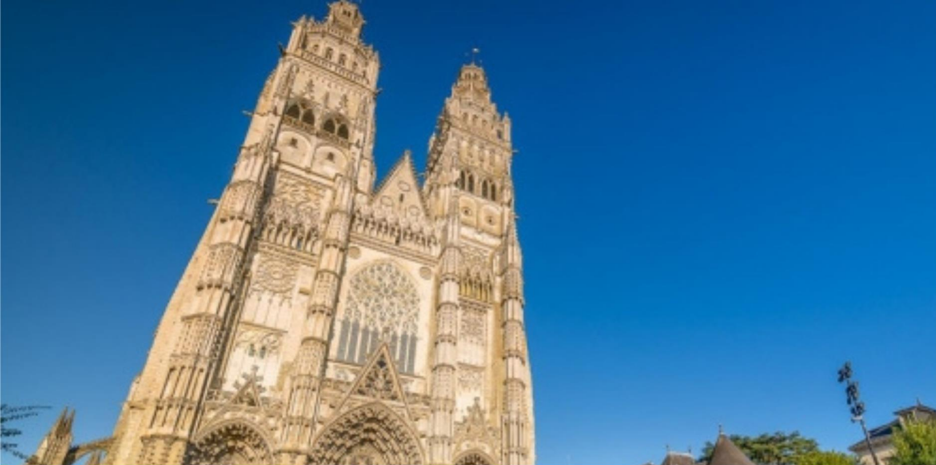
La Cathédrale Saint-Gatien, livre ouvert de l’art gothique, se situe dans le prolongement de la rue Colbert, vivante et piétonne, avec son enfilade de restaurants et de bars branchés.