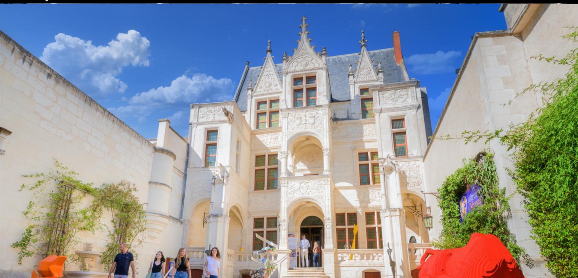
Visible depuis la rue du Commerce, la façade et la cour de l'Hôtel Gouin sont un des plus anciens décors " Renaissance " de la région. Aujourd'hui utilisé comme salle d'exposition, la finesse du travail de la pierre et la beauté du style italien illuminent le lieu.