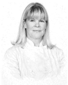
Ghislaine Arabian Première femme chef étoilée Restaurant Les Petites Sorcières, Paris