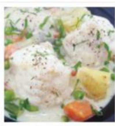
Blanquette de lotte