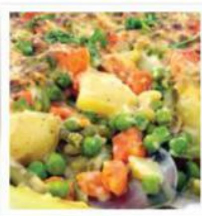
Gratin de légumes printaniers