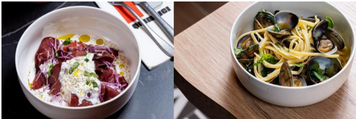
Bresaola stracciatella / Linguine alle vongole

La cuisine ouverte, les différentes typologies d'assises, banquettes et tables d'hôtes créent naturellement une animation de l'espace. « La gamme chromatique, en complémentarité des verts, est composée de couleurs chaudes dans l'esprit d'une Trattoria lumineuse, colorée et vivante » décrit Jean-Philippe Nuel.