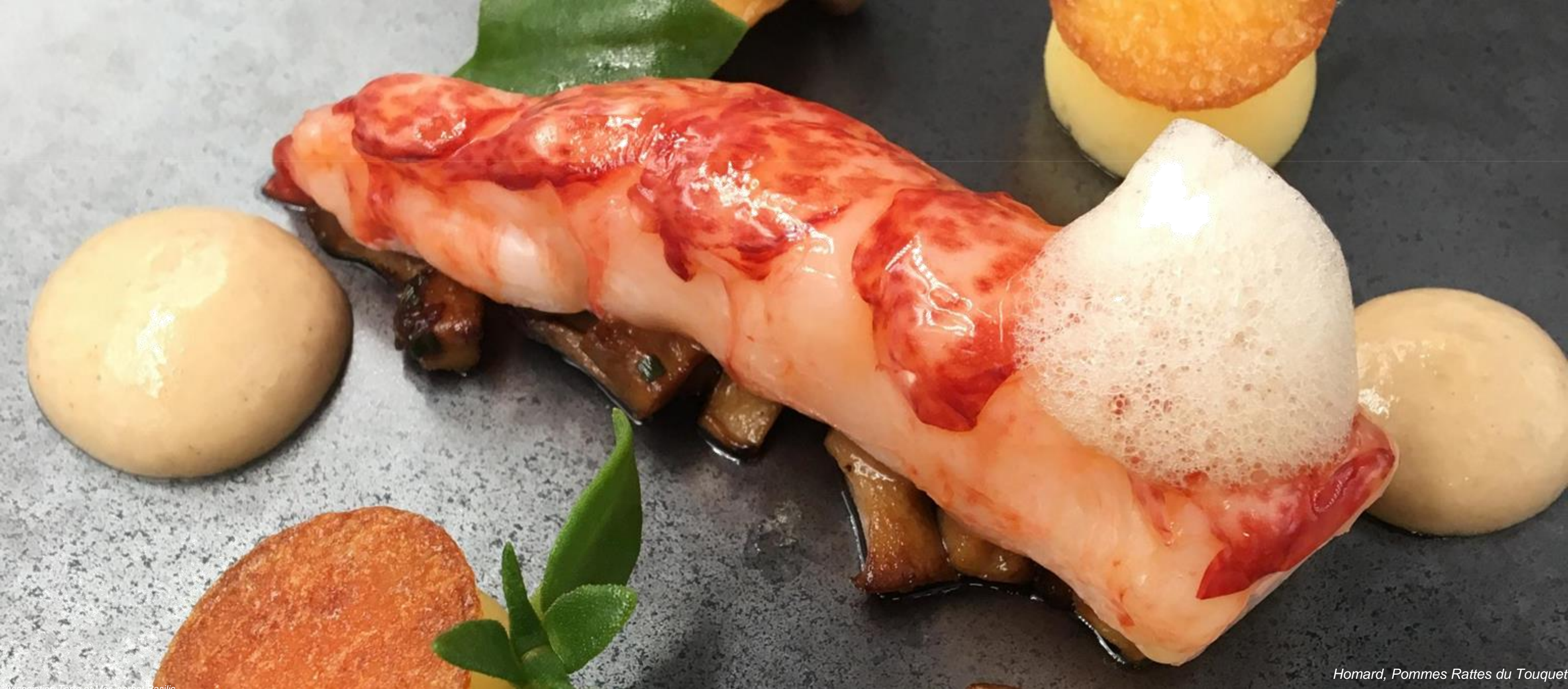
Homard, Pommes Rattes du Touquet