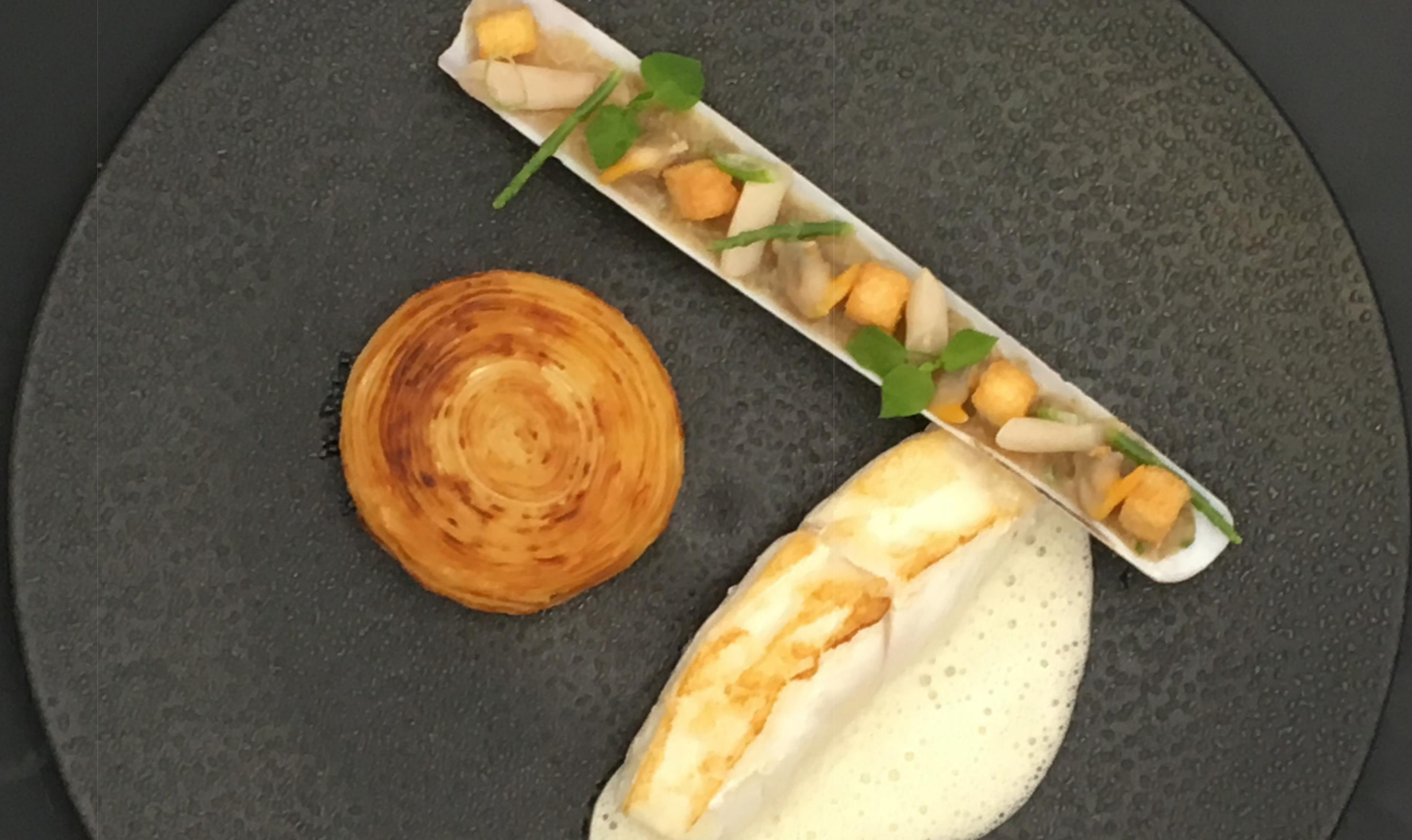
Turbot - couteaux