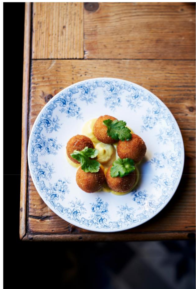
Buckets de croquettes de pot-au-feu

Poutargue, purée de roquette à l'huile de chanvre, sarrasin torréfié & sauce cocktail