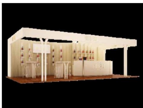
PLATEAU DE DEGUSTATION FRANCE Stand N°35

Pour parvenir à créer ces breuvages d'exception et de qualité, Les Bienheureux réalisent un long travail de recherche et de développement afin de proposer des produits uniques et multiprimés pour certains.