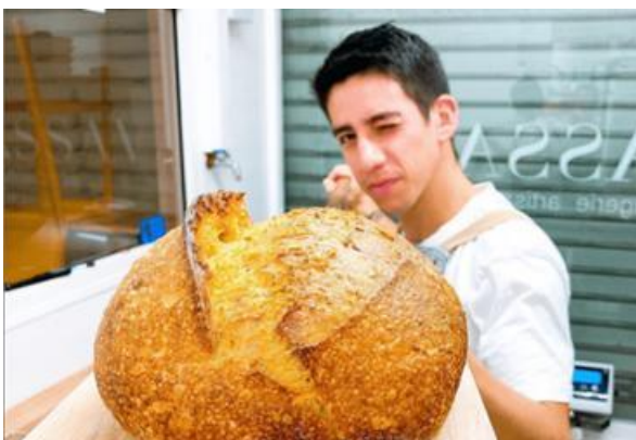
Témoignage d'un artisan resté en tarif bleu grâce à RSW

« Lorsque nous avons décidé d'ouvrir notre boulangerie/snacking, c'était dans un ancien salon de coiffure. Donc notre compteur était en 36 kVA tarif bleu. Dans ce petit espace de 82m 2 , tout est compact mais très bien pensé. L'espace accueille deux fours à sole (un four sole deux niveaux + un four mixte), nos machines à laver, une plaque à induction, la hotte, le salon snacking et notre espace de vente. En additionnant nos besoins électriques, ça ne passait tout simplement pas. Nous avons un besoin de 59 kVA foisonnés donc d'un abonnement de 60 kVA.