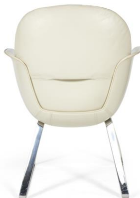
AGENCE JOUIN-MANKU Patrick JOUIN

Lot de 4 ou 6 chaises - 2014 Éditeur Poliform 88 × 66 × 60 cm Estimation : 400 - 500 €