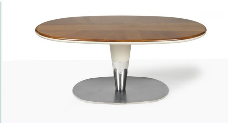
AGENCE JOUIN-MANKU Patrick JOUIN Plateau ovale en marqueterie de chêne exécuté par la maison Rinck Estimation : 4 000 - 5 000 €

Les tables rondes et ovales, qui seront proposées à la vente, ont été réalisées par la Maison Rinck. Les plateaux des tables sont en chêne massif ; le motif du bois reproduit un décor de marqueterie moderne, où les veinures du bois se rencontrent et se croisent de façon géométrique et raffinée. Ces tables sont conçues pour être utilisées sans nappe, chose rare à l'époque de la conception, pour un restaurant étoilé.