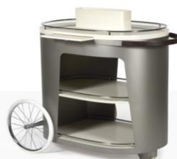
AGENCE JOUIN-MANKU Patrick JOUIN Chariot de présentation - 2014 Estimation : 800 - 1 000 €