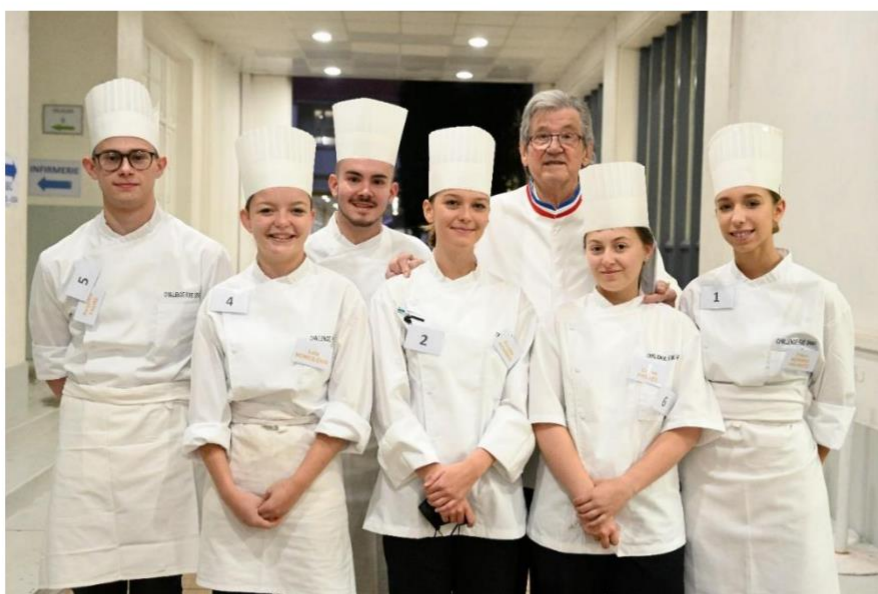
Les 6 finalistes du Challenge Foie Gras 2021

Créé en 2005, ce concours est destiné à découvrir les nouveaux talents de la cuisine. Il permet aux futurs chefs de se familiariser avec l'étendue des possibilités culinaires offertes par le Foie Gras, le Magret et le Confit. Tous les ans, il remporte un vif succès dans toutes les régions de France. Ces mets incontournables de la gastronomie française sont, en effet, une grande source d'inspiration pour ces jeunes talents âgés de 16 à 24 ans. Chaque année, ils ont l'opportunité d'imaginer de nouvelles recettes à base de Foie Gras, de Magret et de Confit à l'occasion de ce grand concours organisé par le Cercle des Amoureux du Foie Gras, sous l'égide du CIFOG (Comité Interprofessionnel des palmipèdes à Foie Gras). Chaque année, certains les finalistes du Challenge font partie des jeunes recrues qui passent les sélections pour l'émission « Objectif Top Chef » notamment.