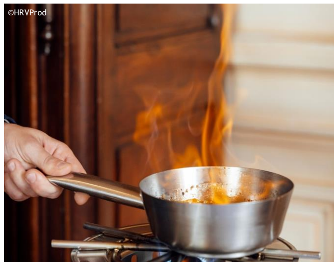
La réalisation des quatre ateliers n'aurait pas été possible sans le précieux soutien des partenaires du Trophée du Maître d'Hôtel.