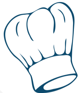
Affiche du dispositif de communication