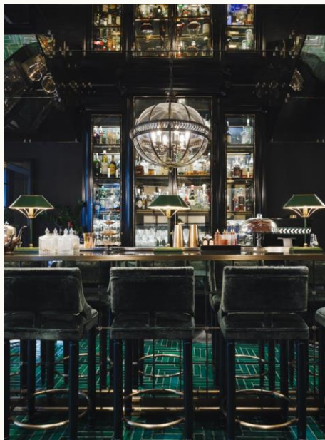
Monsieur George, Paris 8