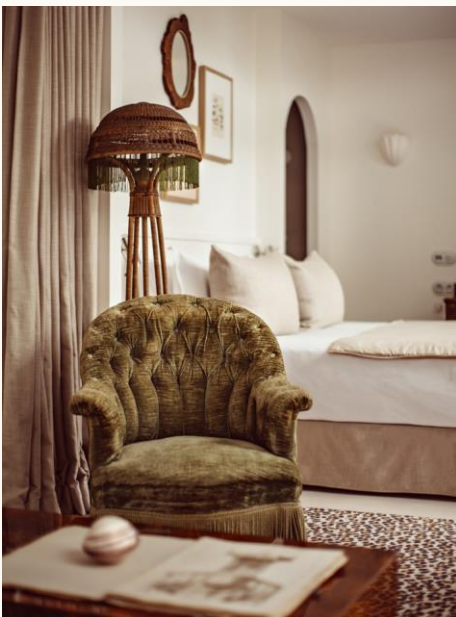
Monsieur Aristide, Paris 18

Legal: Weil Gotshal & Manges, White & Case / Structuring: Freshfields Bruckhaus Deringer / Tax and Financial: Deloitte / Notary: C&C / Commercial: Jones Lang Lasalle.