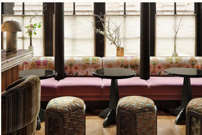
Hôtel Hana, Paris 2

MONSIEUR ARISTIDE ***** 3, rue Aristide Bruant, Paris 18.