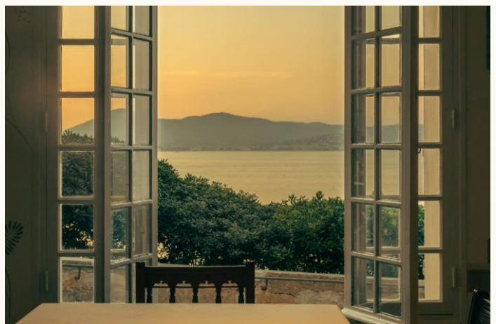
Hôtel La Ponche, Saint-Tropez