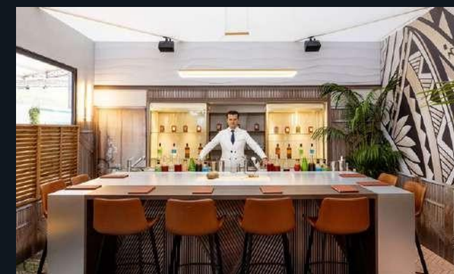
Le bar londonien Kwant spécialement recréé à Paris, lors de l'édition de la Cocktail Street 2023.

La proposition est inédite : le bar invité est redessiné comme dans l'adresse d'origine, les équipes sont délocalisées exceptionnellement pendant trois jours et proposent une carte de cocktails inspirée de leurs créations habituelles mais repensée pour l'événement.