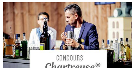
CONCOURS Chartreuse® TOQUICIMES EXPÉRIENCE

Voilà un titre que les restaurateurs mègevans se jalousent d'une année sur l'autre. Il s'agit toujours de tremper du pain dans du fromage fondu certes, mais les chefs locaux rivalisent d'imagination pour revisiter ce plat symbole de partage et subliment leur formule. Le vainqueur pourra, durant une année, afficher et promouvoir son titre. Qui succèdera à l'Alpage du Fer à Cheval, lauréat 2020 ? Dix finalistes* ont été retenus lors de la pré-sélection du 21 août et peaufinent d'ores et déjà leur plat de partage en vue de la dégustation, qui se déroulera le dimanche 24 octobre, présidée par Anne-Sophie Pic.