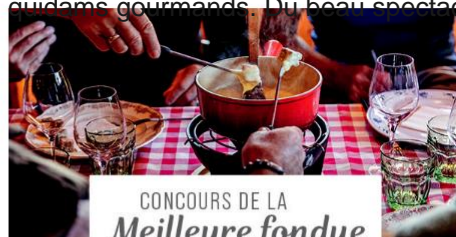
CONCOURS DE LA Meilleure fondue DE MEGÈVE

Un peu de tradition, quelques ingrédients typiques et beaucoup de passion... Les compétitions de Toquicimes rassemblent chefs, cuisiniers amateurs et gourmands. Du beau spectacle !