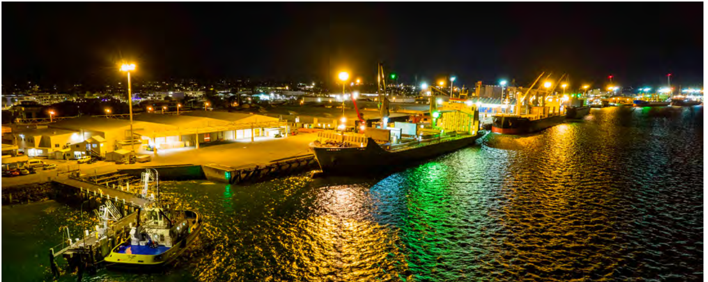
Ceres Two quittant le port de Tauranga.