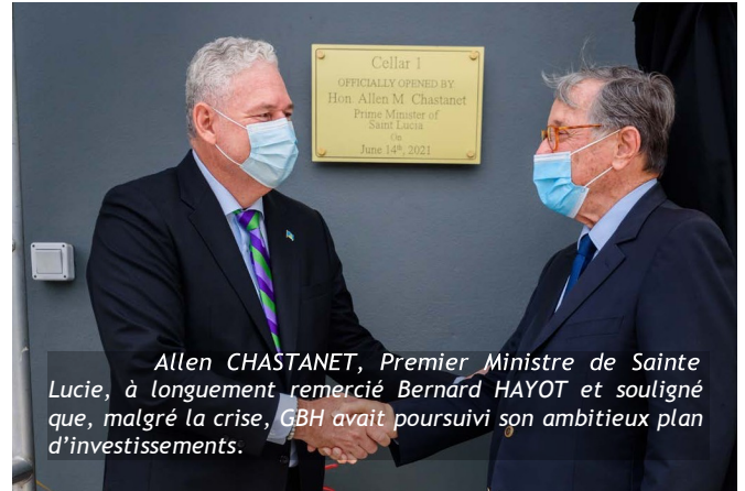
Allen CHASTANET, Premier Ministre de Sainte Lucie, à longuement remercié Bernard HAYOT et souligné que, malgré la crise, GBH avait poursuivi son ambitieux plan d'investissements.

Les nombreuses personnalités présentes ont pu assister à l'inauguration de ces nouvelles infrastructures qui pourront accueillir plus de 7000 fûts supplémentaires. Un 3 ème bâtiment destiné aux transferts de rhum et aux différentes opérations de ouillage offriront des conditions de travail et de sécurité optimales.