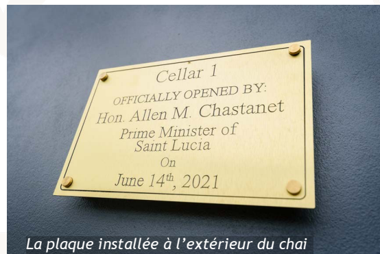
La plaque installée à l'extérieur du chai

Unique distillerie de rhum de l'île, St. Lucia Distillers connaît un nouveau souffle depuis son acquisition par GBH fin 2016. Conformément à ses engagements, le groupe familial originaire de la Martinique mène un vaste programme d'investissements et nourrit l'ambition de propulser l'unique distillerie de l'île aux côtés des grands acteurs internationaux présents sur le segment du rhum premium. St. Lucia Distillers, qui possède trois alambics et une colonne à distiller, élabore et assemble différents blends commercialisés sous les signatures Chairman's Reserve, Bounty et Admiral Rodney.