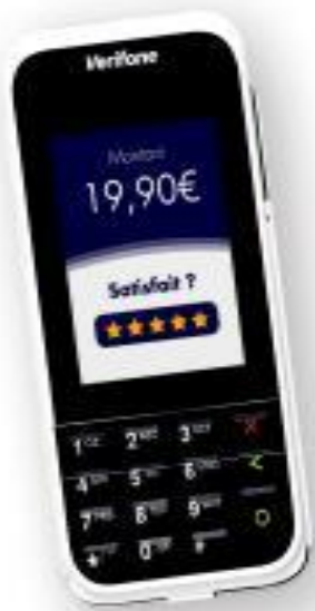
Le nouveau TPE e285p

Le paiement à table : Connecté directement au système de caisse L'Addition, le Paiement à Table propose aux clients de régler par QR code à table, depuis leur smartphone. Le client a ensuite accès à son ticket de caisse et son justificatif directement sur son smartphone, sans besoin d'impression.