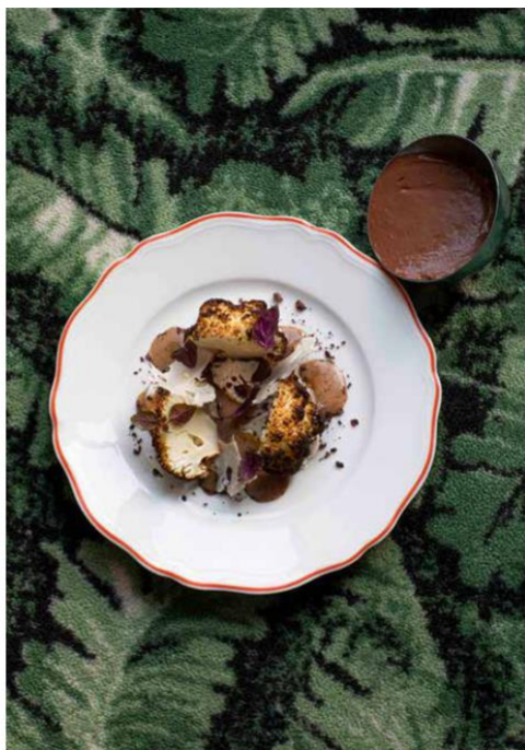
Chou-fleur rôti, cascara de café avec un granité cascara/citron