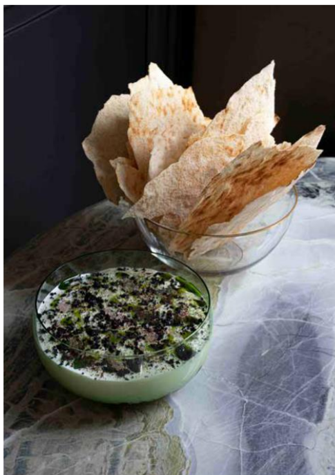
Yaourt, concombre et menthe accompagné de pain carasau