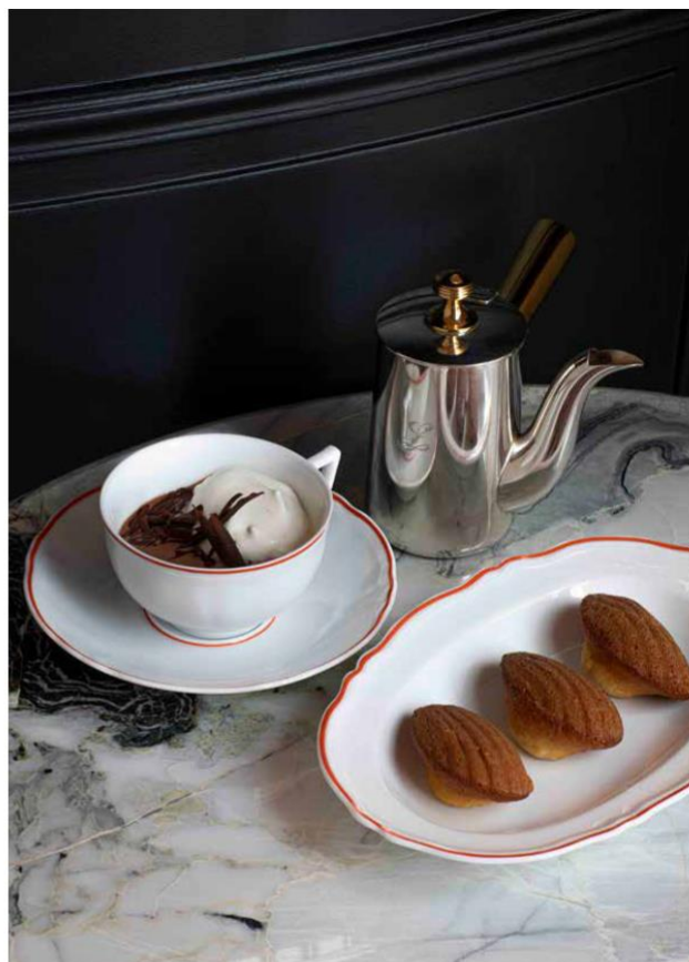
Chocolat chaud et mini madeleines