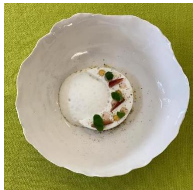
Suspendu sur un nuage