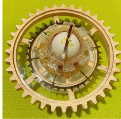
L'air du temps

Pâtisserie Benoît Lagache à Lambersart (59)