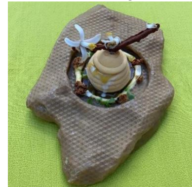
De la ruche à l'agrumes

Restaurant La Cabro d'or aux Baux-de-Provence (13)