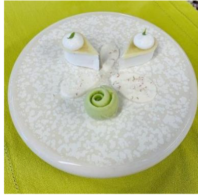
Fraîcheur pomme du Montois, coco et pointe cumin