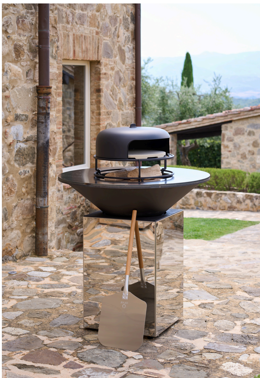
OFYR Pizza Oven 100, prix : 295 €

Avec les bons accessoires, votre appareil OFYR révèle tout son potentiel. Ces outils sont conçus pour faciliter votre processus de cuisson, mais surtout pour sublimer l'ensemble du rituel du barbecue. La brunette en acier inoxydable en est un parfait exemple. Cet indispensable permet d'huiler facilement la plaque de cuisson, une étape essentielle pour une préparation impeccable. Pour ceux qui aiment impressionner, le four à pizza constitue l'équipement ultime : il comprend tout le nécessaire, de la plaque en fonte à la pierre à pizza.