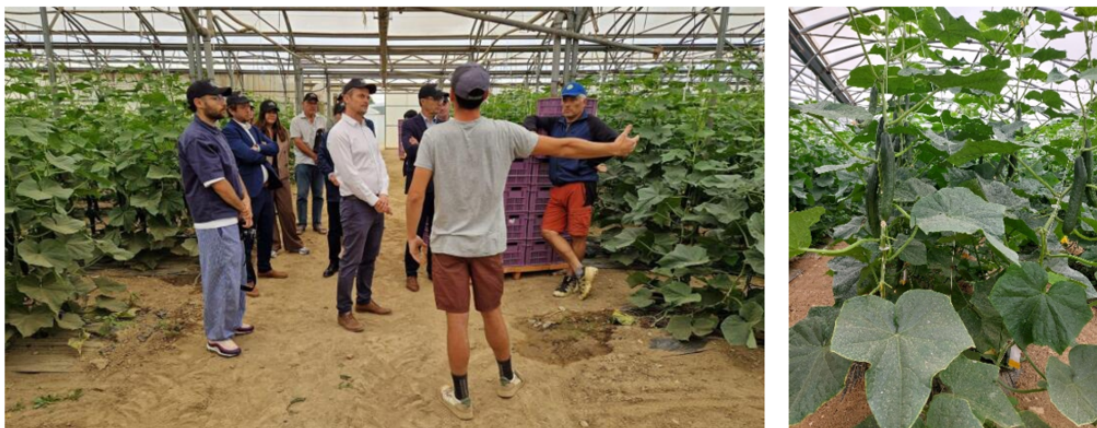
Visite sous les serres d'Ille Roussillon où sont cultivés les concombres