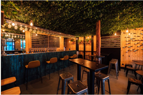
Le bar fondamental, pigalle