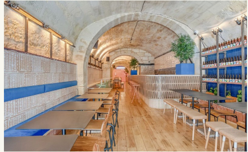
Le bar fondamental, bordeaux