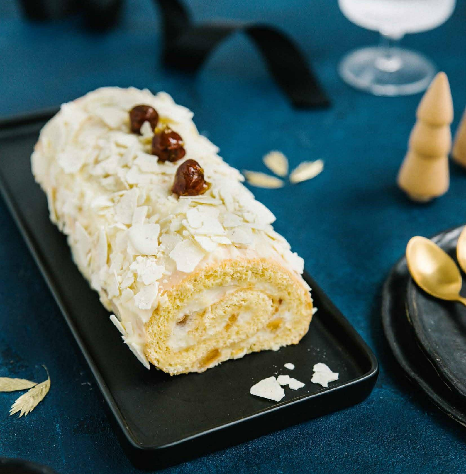
Bûche Crème & Calvados Isigny Sainte-Mère, pomme et chocolat blanc